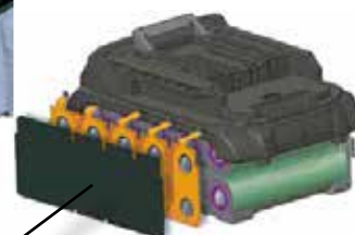
Structure étanche à 3 couches