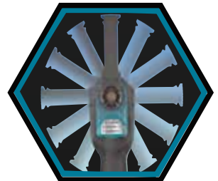
L'outil peut être fixé en 12 crans à 360°.