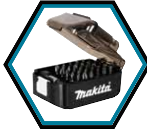
E-00016 - Set d'embouts 31 pièces en forme accu

Livrée avec 2x accus 5.0 Ah, chargeur rapide et coffret de transport Makpac-B + set embouts 31 pces art. E-00016