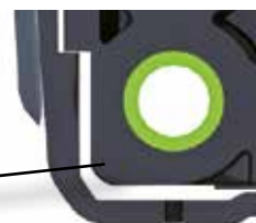
Structure d'absorption des chocs