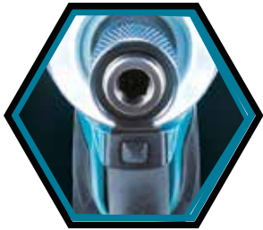
Eclairage LED à 360°.